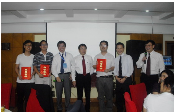
湘雅海外校友会给三位获奖者颁发证书和奖金