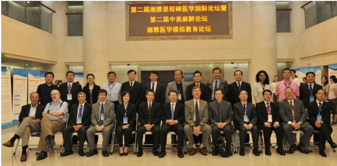
第二届湘雅里程碑医学国际论坛 中国 长沙 2013.09.13-14

由中南大学湘雅医学院，湘雅二医院和湘雅海外校友会联合举办，第二届湘雅里程碑医学国际论坛于9月12日至9月14日在湘雅二医院园满召开。