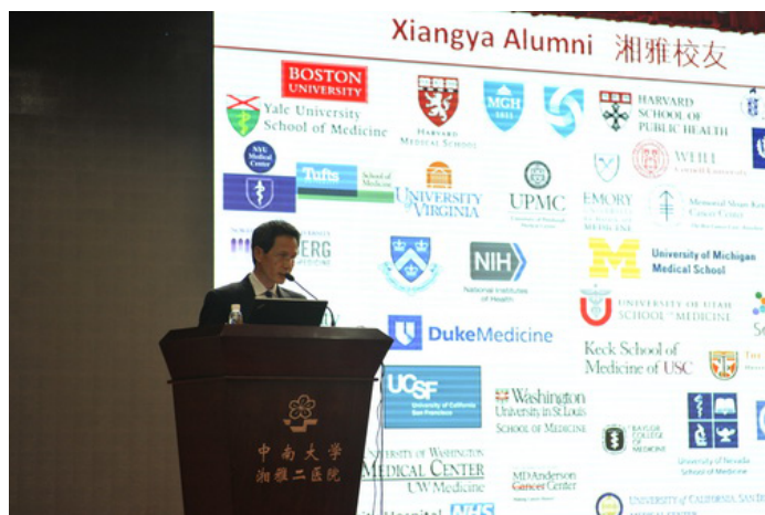
巢卫代表湘雅海外校友会致词

起居，围术期血糖控制，糖尿病患者的日间手术等进行了小组讨论。围绕心血管疾病，专家们讲解了糖尿病心肌病，心衰治疗现状，心脏康复，心脏麻醉，无创性血流动力学监测，重症败血症的信息传递以及TEE在非心脏手术中的应用，并就心脏病的非药物治疗，围术期 \beta -受体阻滞剂的应用和心脏支架患者的围术期处理与听众进行了活跃讨论。在医学模拟教育方面，世界著名专家介绍介绍了模拟教育在医学教育和医疗中的应用，而海内外校友则进行了实例演示，展现了湘雅医学模拟教育所取得的成就，深受与会者的欢迎。此外，吸引听众的还有经典麻醉学课题“困难气道的处理”，以及令人耳目一新的有关临床医学研究和机器人手术麻醉的讲座。